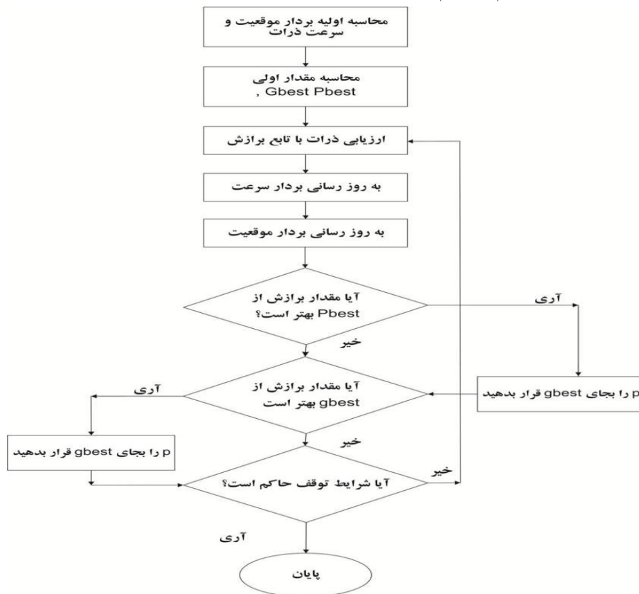
نمودار ب-۱: فلوچارت الگوریتم ازدحام

در زیر فلوچارت الگوریتم ازدحام ذرات نشان داده شده است: